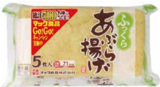
ふっくらあぶら揚げ 5枚