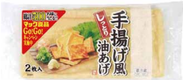
しっとり手揚げ風油あげ 2枚入